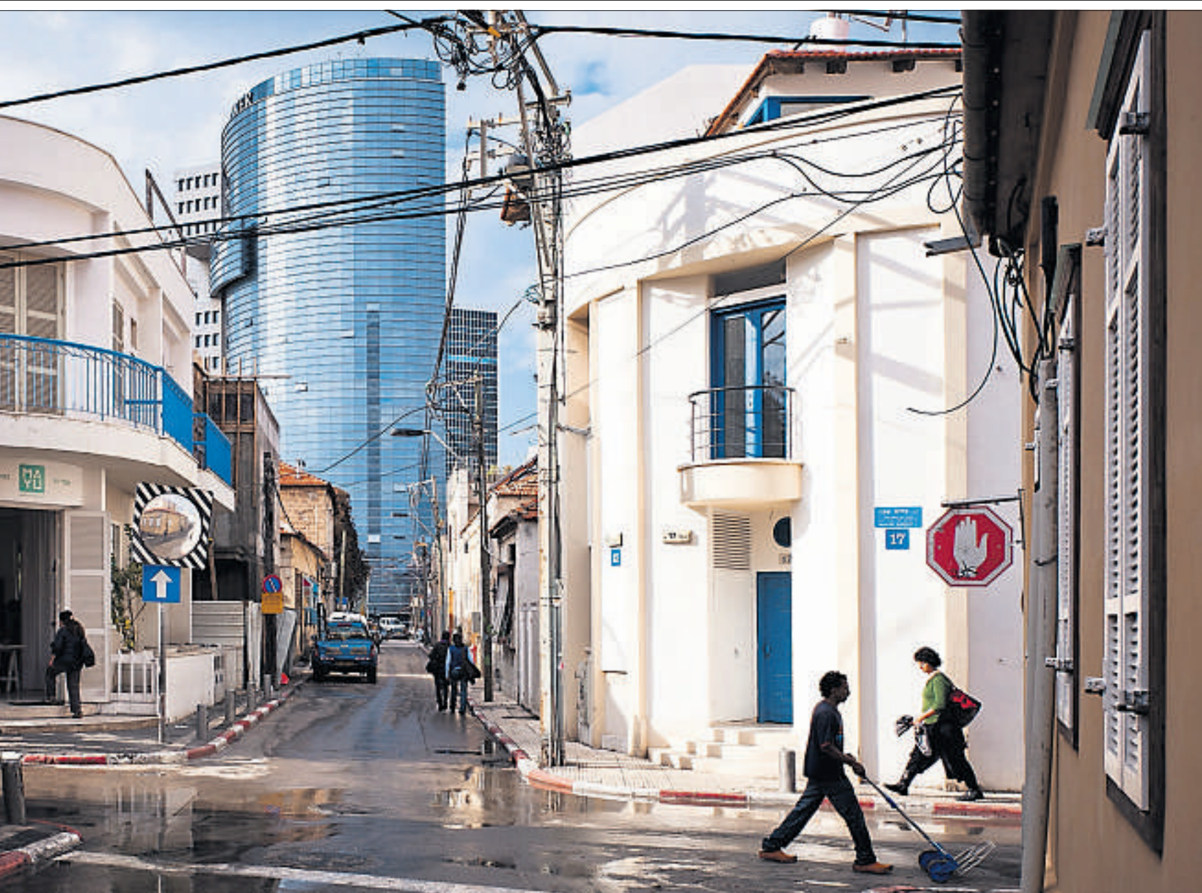
Einmal bei Regen. (6. Januar 2011)