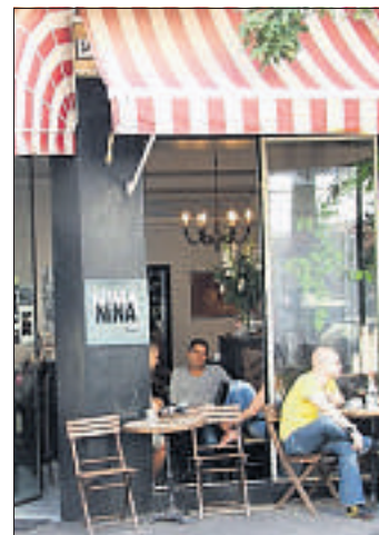
Das Nina-Café in Neve Tzedek.

Restaurants: Tazza D'oro (8) (Ahad Ha'am 6; Tel. 516 63 29): guter Kaffee,