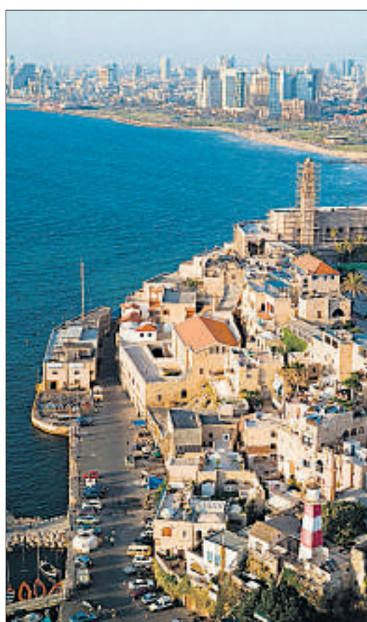
Der Hafen von Jaffa, im Hintergrund Tel Aviv.

begrünte Rothschild Boulevard mit seiner wertvollen Architektur, das Museum of Art, die eleganten Azrieli Towers, die Märkte um die Kreuzung Allenby / King George Street. Die Cafés und Boutiquen in der Sheinkin Street, die Meerespromenade. Ganz im Norden liegt auch der «Old Port», ein Gelände am Wasser, das mit unzähligen sich ähnelnden Restaurants, Bars, Läden und Clubs auf Massenkonsum und -tourismus ausgerichtet ist. Wer Neve Tzedek kennt, kann sich dort kaum mehr wohlfühlen.