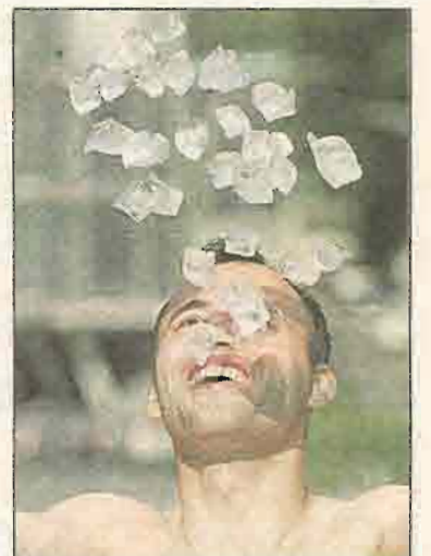
Mit gefrorenem Wasser lässt sich durchaus Geld verdienen.