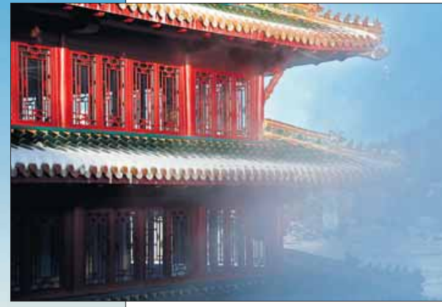
Dank des Seebads mit 28 Grad warmem Wasser lässt es sich selbst im Winter gut aushalten im Turrachsee – den man vom Chinaturm des Hotels Hochschober komplett überblickt.

bad: Floßgleich schwimmt der Beckenrand auf dem Wasser, von ihm hängt eine Neoprenschürze drei Meter tief in den See. So ist einerseits ein steter Wasseraustausch gewährleistet, weil das Bassin nicht geschlossen ist. Andererseits kann die Wärme nur nach oben, an die Oberfläche, entweichen.