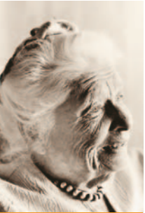
Dr. Ida P. Rolf - Gründerin der Rolfing®-Methode

Benannt ist die Rolfing®-Methode nach der Begründerin Dr. Ida P. Rolf (1896-1979). Als eine der ersten Frauen mit einem Dokortitel in Biochemie galt sie zu ihrer Zeit als Pionierin, die sich durch unglaubliche Neugierde und Forschungsdrang auszeichnete. Neben ihrer Arbeit als Professorin an der Rockefeller-Universität in New York City beschäftigte sie sich mit dem damals noch nicht so bekannten Yoga. Eigene gesundheitliche Probleme animierten sie, ihre Bewegung - speziell beim Yoga - zu studieren. Außerdem lernte sie viel von Osteopathen. Mit diesem Wissen entwickelte sie bald ihren eigenen Stil.