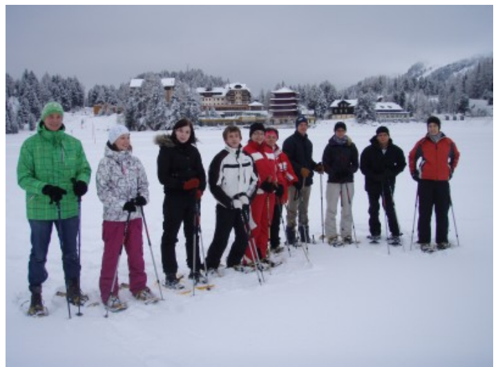
Zuerst mussten sich alle an die Schneeteller gewöhnen – doch alle hatten den Dreh gleich raus.