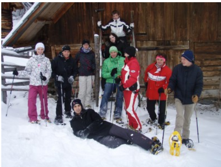
Kurze Verschnaufpause bei der Katscherhütte – wir sind wieder auf dem Weg nach Hause.