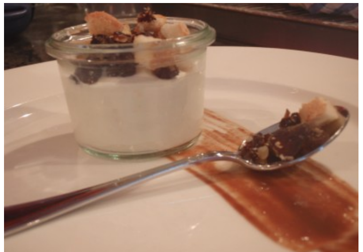
Der Käsegang – Frischkäse und Dörrobst.