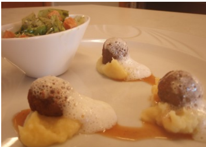
Die Kalbfleischpralinen auf Kartoffelpüree.

Lauter wohlschmeckende Klassiker neu interpretiert. Wir verwendeten ausschließlich Produkte aus der Region und verwöhnten drei Tage lang die Gourmetfreunde im Almenland. Täglich zelebrierten wir kulinarische Tafelfreuden auf höchstem Niveau. Es war großartig. Die Gäste waren begeistert und ließen uns ihre Freude und Anerkennung in Form von Küchenrunden spüren. Ich möchte mich hiermit bei allen bedanken, die in irgendeiner Art und Weise dabei waren und freue mich schon aufs nächste Jahr, wenn wir wieder beim Postwirt die Kochlöffel schwingen und mit Freunden kochen.