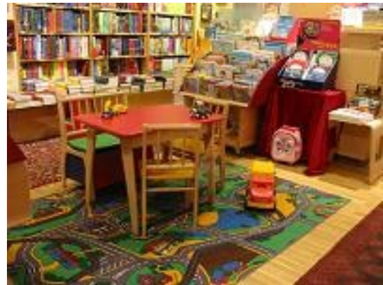
Da möchte man wieder Kind sein!