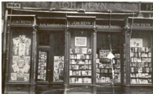
Buchhandlung seit 1868

Die Buchhandlung ist auf 2 Etagen aufgeteilt und mit einer geschwungenen Treppe verbunden. In den Sachgebieten (Romanabteilung, Technik, Naturwissenschaft, Wein & Co, Kochen, Kinder- und Jugendbücher, Fantasy & Science Fiction usw.) arbeiten sehr eigenverantwortliche SpezialistInnen. Sie sind für die Neu- und Nachbestellungen, die Logistik und die Beratung in ihrer Abteilung zuständig. Lehrlinge bildet der Betrieb auch aus – der Lehrberuf heißt „Buch- und Medienwirtschaft“ und die Schulzeiten werden in der Österreichweit einzigen Berufsschule in St. Pölten abgewickelt. Weiter ging mein Rundgang in Richtung Buchhaltung. Dort arbeiten zwei Damen – eine für die Kundenbuchhaltung und eine für die Abrechnung mit den Lieferanten. Man unterscheidet Verlagsauslieferungsdienste und das Barsortiment. Erstere tragen im Gegensatz zum Barsortiment kein Verkaufsrisiko und haben das komplette Verlagsprogramm im Lager.