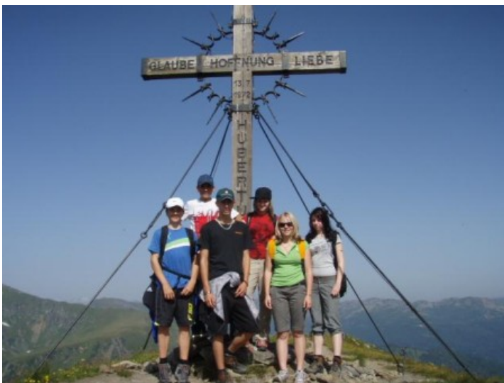
Das erste Ziel erreicht, der Gipfel vom Hausberg - der Schoberriegel (2.208m).