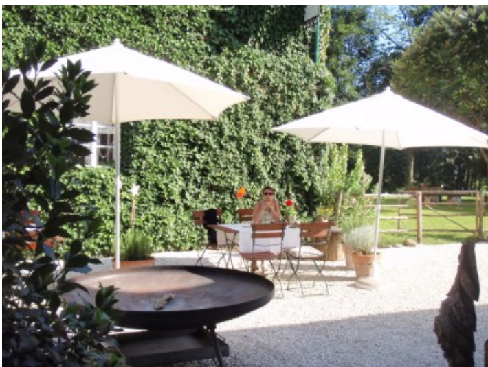
Die schön gestaltete Terrasse.