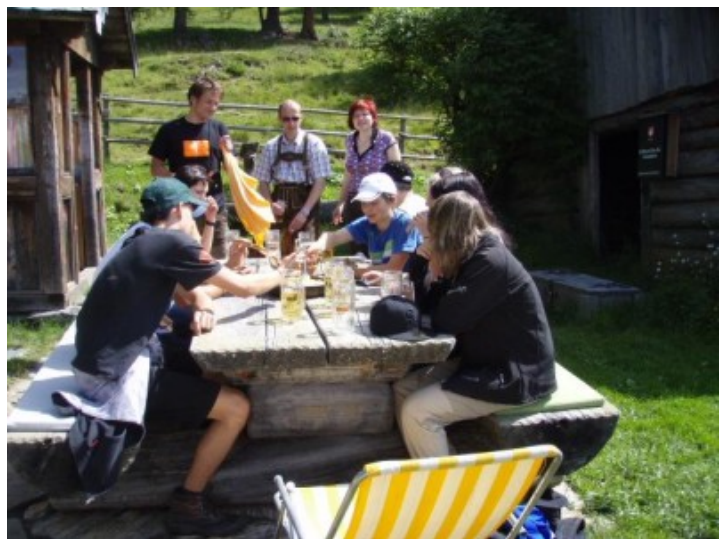
Nach dem Aufstieg gab es eine Stärkung bei Michael auf der Sam Hütte.