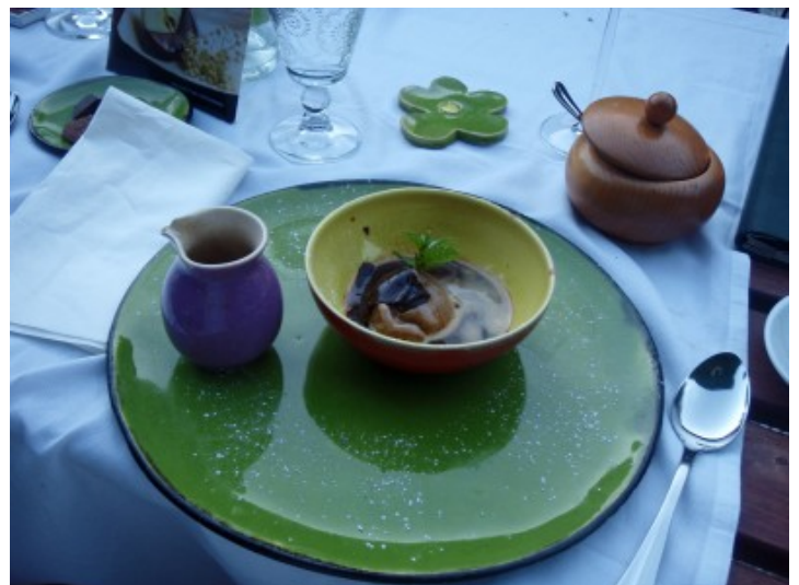
Das Dessert auf den selbst hergestellten Geschirr.