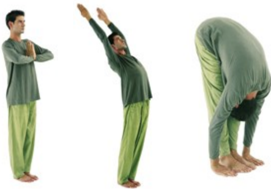
1 Schnaufen 2 Einatmen 3 Ausatmen

Beginne den Tag um die Reinheit und Neugeburt des Morgens für dich zu nützen! Dazu eine einfache Übung: