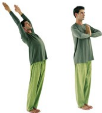
4 Einatmen 5 Ausatmen

Führe diesen Zyklus 5x durch und verweile am Ende